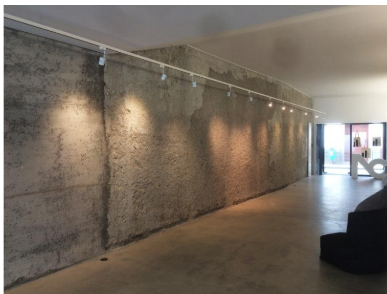
Figura 5 – Vista do pátio