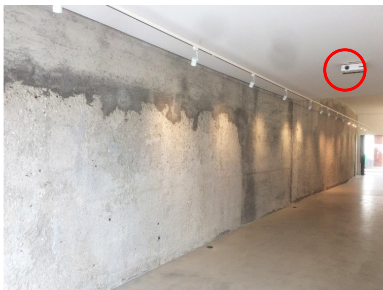
Figura 3 – Vista da parede — Projektor