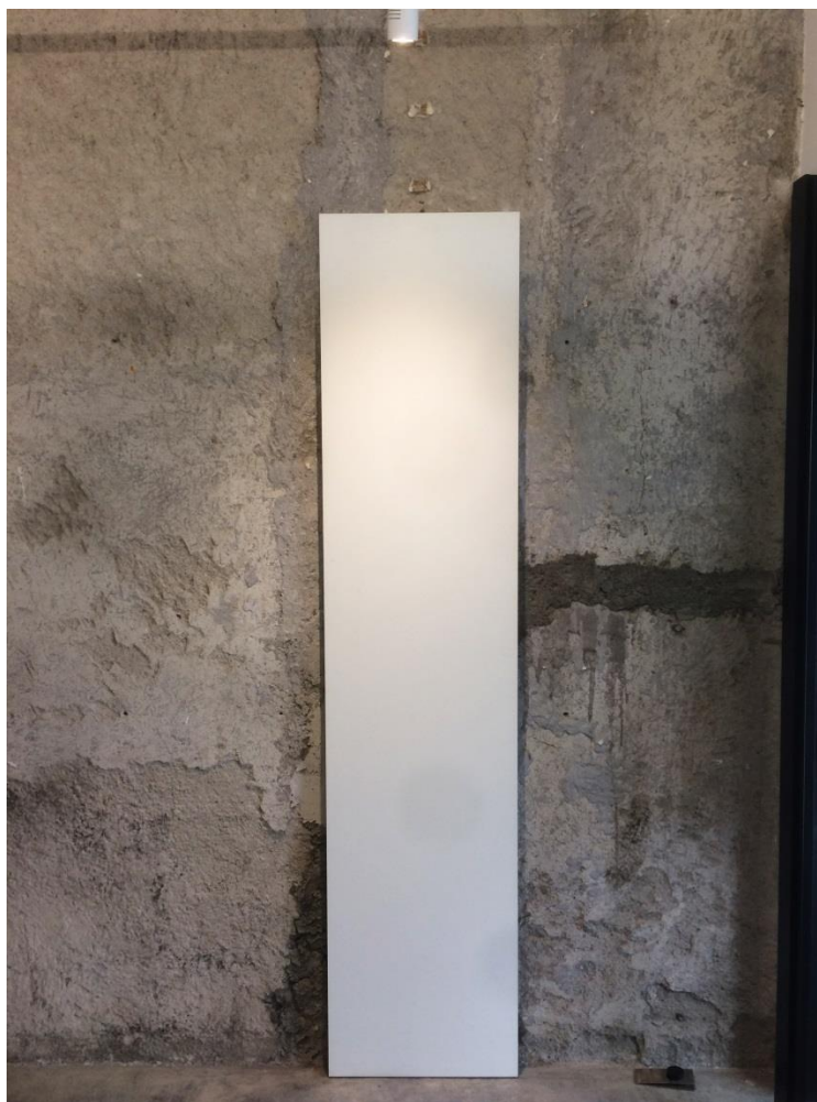
Figura 2 – Painel introdutório